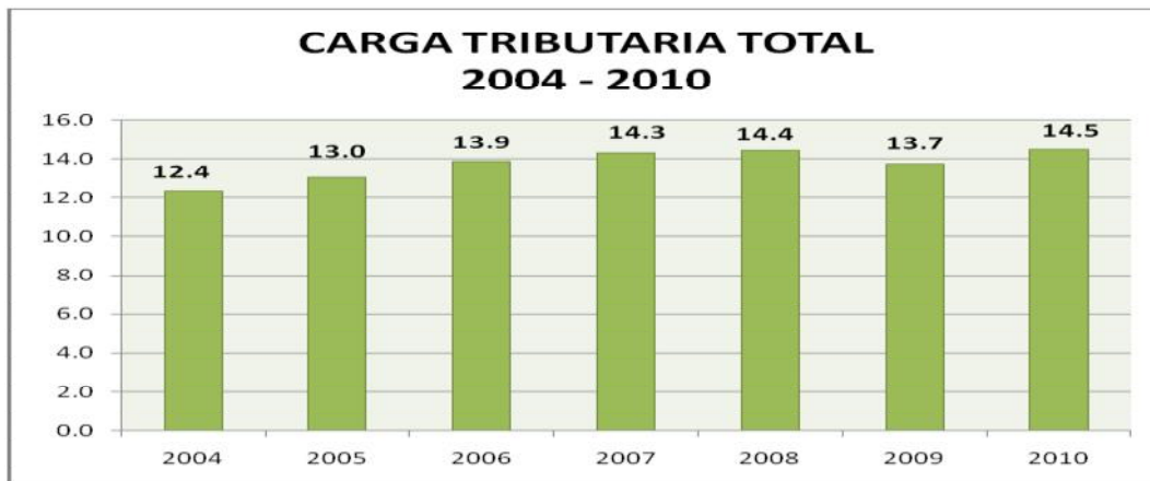
Grafica No. 1

Dado que este es un proyecto novedoso, sobre la temática no se tenían datos para establecer una línea base en términos de comparar la situación inicial, con la situación mejorada, por lo que los resultados del proyecto, están contribuyendo a generar una mejor cultura tributaria en el país.